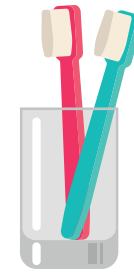
brosse à dent