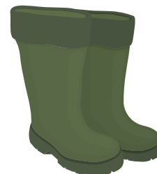
botte de pluie